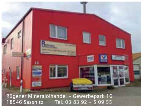
Rügener Mineralölhandel – Gewerbepark 16 18546 Sassnitz Tel. 03 83 92 – 5 09 55

Nicht alle Abfälle können von der Abfallwirtschaft für Rügen ständig entsorgt werden. Gerade die Entsorgung von Schadstoffen bzw. der Sonderabfälle ist unserem Entsorgungsbereich nicht unproblematisch, da die Abgabemöglichkeiten am Schadstoffmobil nur zweimal im Jahr besteht. Um den Bürgern zu ermöglichen, bestimmte Abfälle ganzjährig abgeben zu können, informiert die AfR hier über private Kooperationspartner.